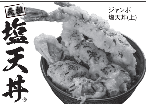
ジャンボ 塩天丼(上)

テイクアウト承ります。 別途、容器代+50円を頂戴いたします。 ※事前にご連絡を頂ければ、お待たせせずにお渡しすることができます。