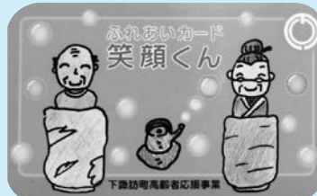
【下諏訪町ふれあいカード笑顔くん】

「下諏訪町ふれあいカード笑顔くん」を提示の上、高齢者1回券または回数券で入館した方に、次回から利用できる無料入館券をお一人につき1枚差し上げます。 この機会にぜひご利用ください。